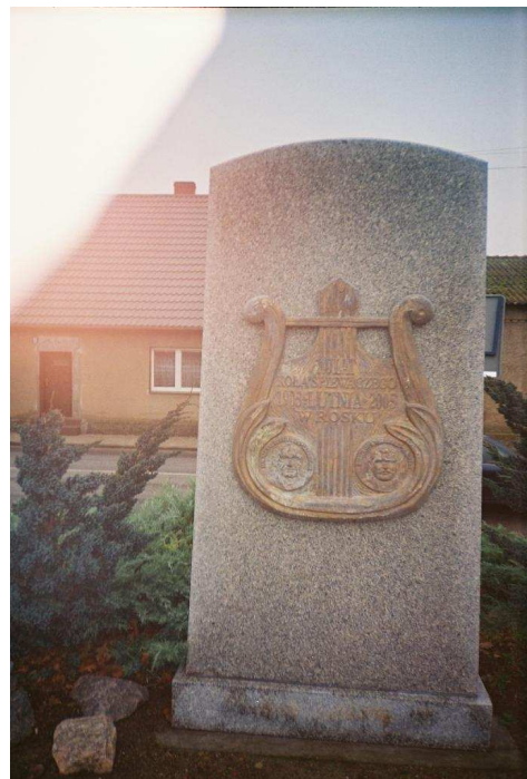
Pomnik Chóru Lutnia