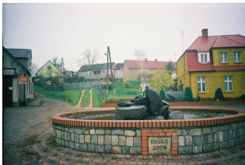
Centrum wsi z fontanną czynną cały rok

Zharmonizowana z okoliczną przyrodą zabudowa wsi wraz z jej zabytkami owocuje przepięknymi krajobrazami, cieszącymi zarówno mieszkańców, jak i turystów.