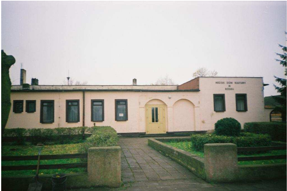
Wiejski Dom Kultury