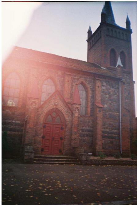
Neogotycki kościół z kamienia